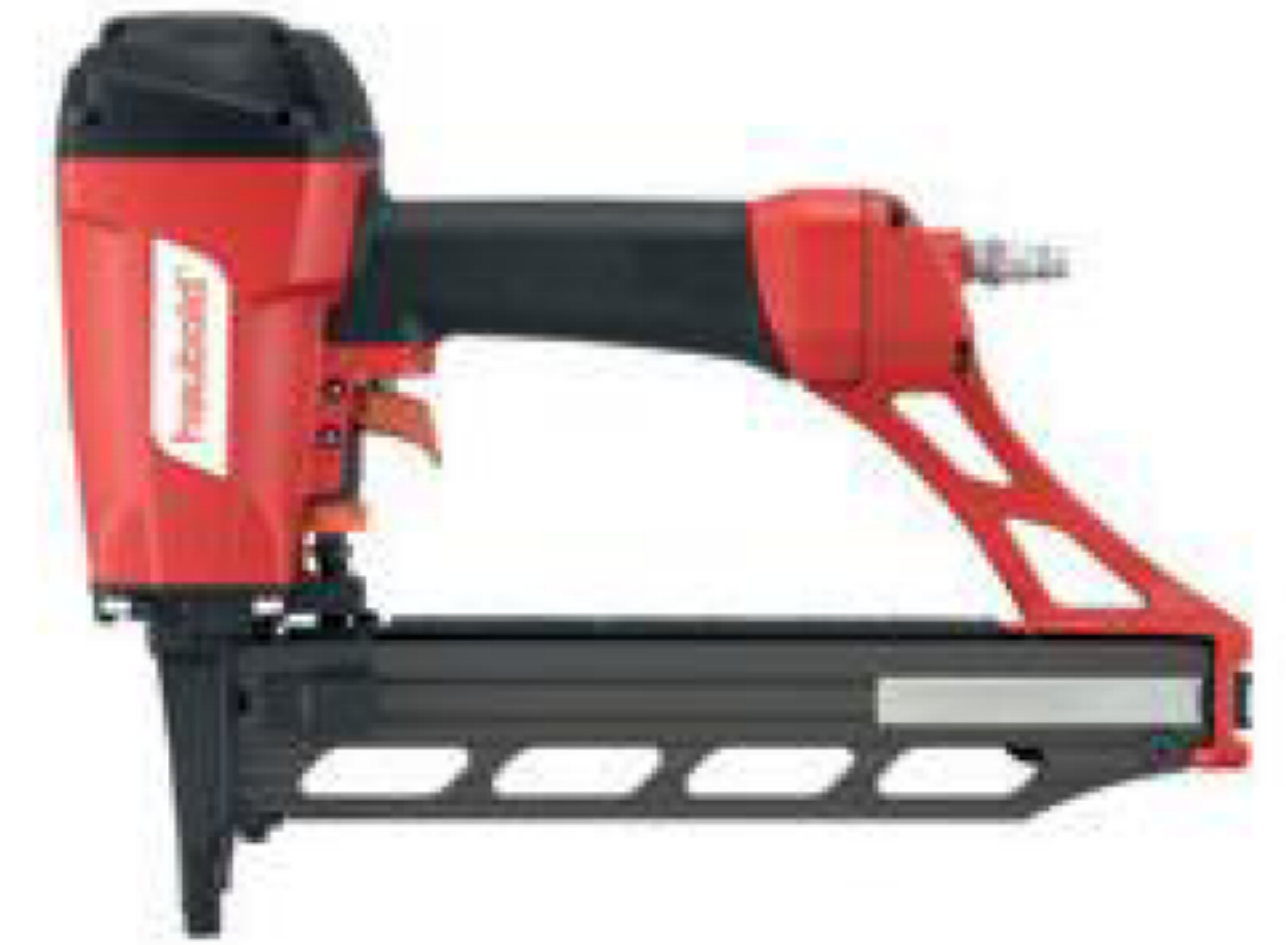
Serie KG 700